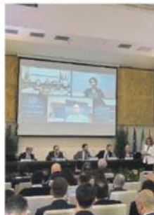
I lavori della "Masterlaac"

È fondamentale dunque creare un network intra ed extra-ospedaliero, per permettere il coordinamento tra vari livelli assistenziali per la gestione completa del paziente in tutte le fasi della malattia. Gli strumenti necessari per la creazione di queste reti tra specialisti sono innanzitutto la sensibilizzazione del territorio e una formazione continua, oltre alla conoscenza e l'esperienza condivisa di un gruppo di lavoro multidisciplinare. Il contest Masterlaac, in questa direzione, ha contribuito anche a potenziare la campagna informativa per i pazienti sui sintomi, fattori di rischio, prevenzione e conoscenze di tutte le opzioni terapeutiche percorribili.